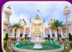
ชมมัสยิดกลางปัตตานี