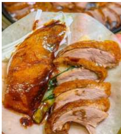
*ภาพนี้ใช้เพื่อการโฆษณาเท่านั้น*