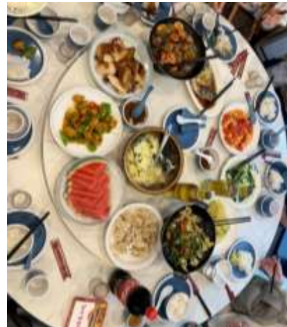
*ภาพนี้ใช้เพื่อการโฆษณาเท่านั้น*