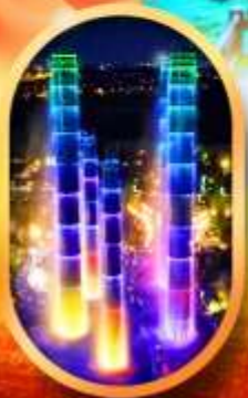
SKP Global Center