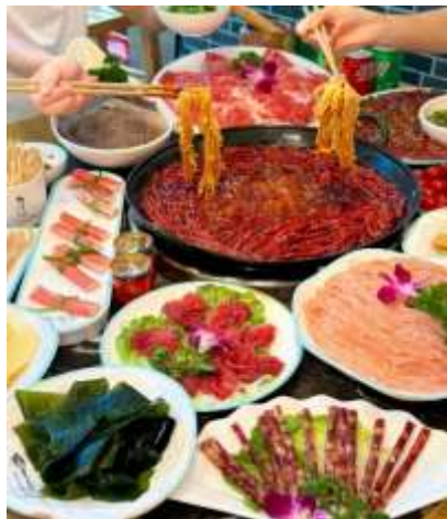
*ภาพนี้ใช้เพื่อการโฆษณาเท่านั้น*