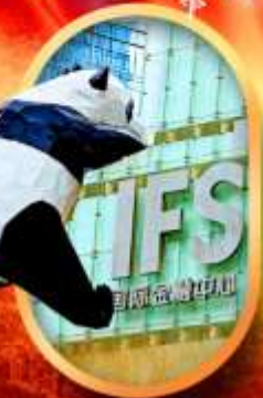
IFS หมีแพนด้าป็นตึก