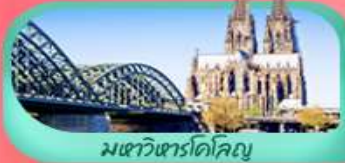
มเซวัวร์โคโลญ