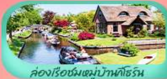
คลองเรือชมหมู่บ้านนิฮอร์น

หนึ่งปีมีครั้ง! ชมเทศกาลดอกทิวลิป สวนเคอเคนฮอฟ Keukenhof 2026 แลนด์มาร์คโดดเด่นมหาวิทยาลัยโคโลญ สะพานไออินชอลเลิร์น ส่องเรือชมหมู่บ้านนิฮอร์น ถึงหินลมซานส์คินส์ คลองอัมสเตอร์ดัม ตื่นตาตื่นใจกับปราสาทกราวอนสตัน หอระฆังแห่งกนต์ บริสเซลส์ อะโตเมียม พระราชวังหลวงแห่งบริสเซลส์ เซ็คอินไฮโลท์ ประตูชัยฝรั่งเศส หอไอเฟล พิพิธภัณฑ์ลูฟวร์ ส่องเรือแม่น้ำแซนสุดโรแมนติก และช้อปปิ้งจุฑาทิ้งชั๊นนำ