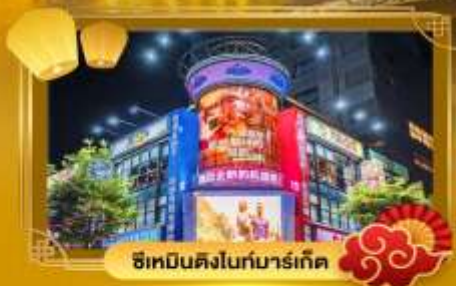
ช้อปปิ้งในท่ามาร์เก็ต