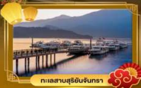
ทะเลสาบสุริยอินจินตรา