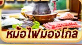
หม้อไฟมองโกเลีย