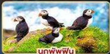
นกพิฟฟิน

📅 เดินทาง : 30 เม.ย. - 07 พ.ค. | 23-30 ก.ค. 69