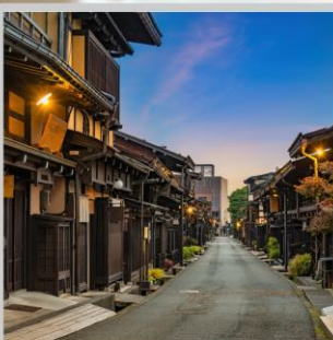
“TAKAYAMA OLD TOWN”