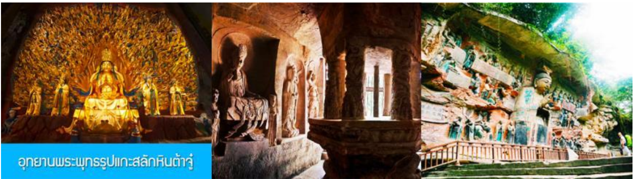
อุทยานพระพุทธรูปแกะสลักหินต้าจู่