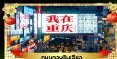
ถนนทวงฉิมเฉียว