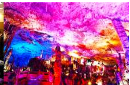
เก้าอี้สวรรค์จิวเกียนต้ง