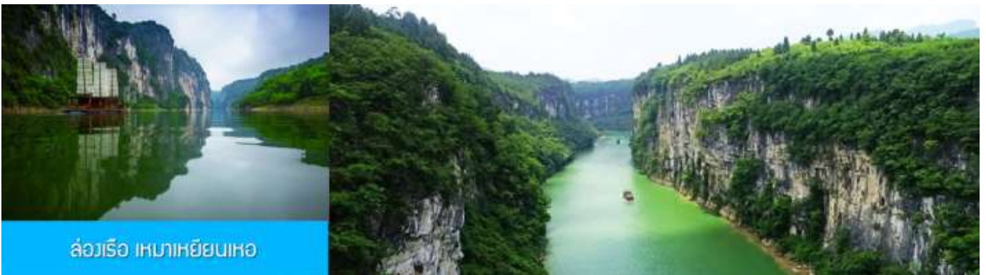
ล่องเรือ เหมาหยินเหอ