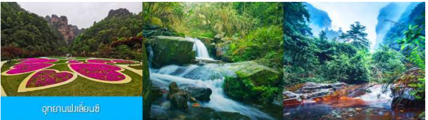
อุทยานฟงเหลียนซี