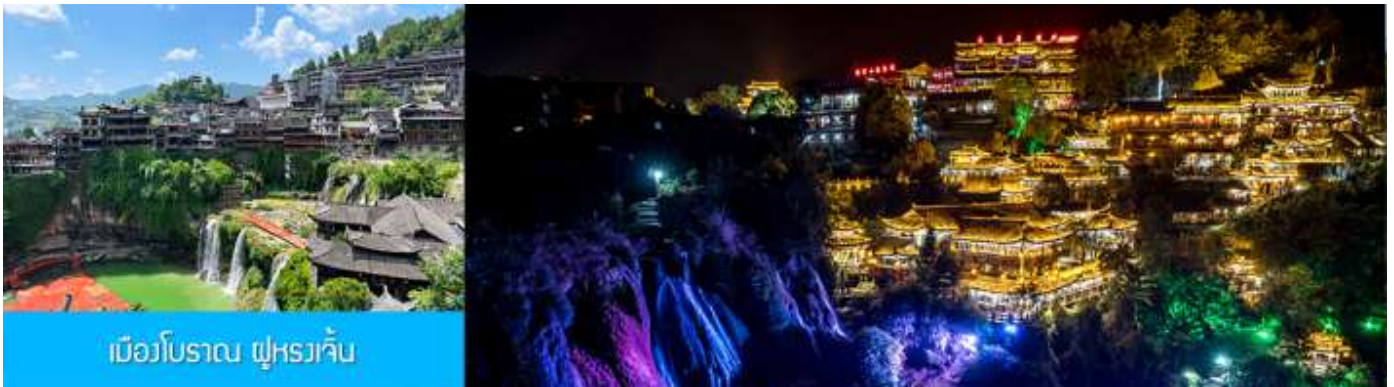
เมืองโบราณ ฝูหรงเจิน

จากนั้นนำท่านเดินทางสู่เมืองฝูหรงเจิน นำท่านเที่ยวชม เมืองโบราณ ฝูหรงเจิน 芙蓉古镇 เมืองโบราณเก่าแก่ขึ้นชื่อของมณฑลหูหนานที่โด่งดังจาก ภาพยนตร์เรื่อง ฝูหรงเจิน เป็นสถานที่ท่องเที่ยวระดับ 4A ที่ได้รับความนิยมจากนักท่องเที่ยวคู่กับเมืองโบราณฟงหวง เป็นสถานที่หลักในการถ่ายทำภาพยนตร์เรื่อง ฝูหรงเจิน ทำให้สถานที่แห่งนี้ยังได้รับความนิยมจากนักท่องเที่ยว จุดไฮไลท์ของเมืองโบราณแห่งนี้ นอกจากบ้านเรือนโบราณสวยเก๋ที่เป็นเอกลักษณ์เฉพาะของมณฑลหูหนาน ที่นี่ยังมีน้ำตกขนาดใหญ่ที่สวยงามกลางเมืองที่เป็นจุดเช็คอิน