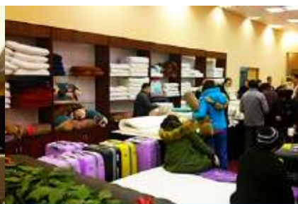
ศูนย์จำหน่ายผลิตภัณฑ์ยาพารา