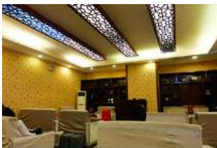
ศูนย์แพทย์แผนจีน

อัตราค่าบริการสำหรับโปรแกรมเสริมการแสดงชุด The love Story of Wooden man and Fairy Fox ท่านละ 400 หยวน (หรือประมาณ 2000.-บาทขึ้นอยู่กับอัตราแลกเปลี่ยน) ระยะเวลาที่ใช้ในการเที่ยวชมการแสดง ประมาณ 3 ชั่วโมง รวมเวลาเดินทางไปกลับค่าบริการรวม ค่าบัตรเข้าชม ค่ารถรับ ส่ง และค่าน้ำเที่ยวของไกด์ท้องถิ่น