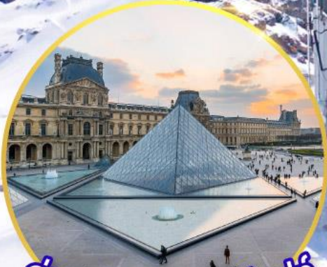
ถ่ายรูปคู่พีพีร์กันที่ลูฟร์