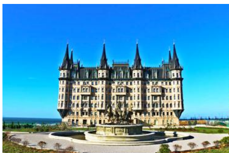
คฤหาสน์เหวินเจิง

นำท่านไปเยือนเมืองท่าสุดโรแมนติคสไตล์ยุโรป ท่าเรือชาวประมง ให้ท่านได้ชมสถาปัตยกรรมสไตล์อเมริกาเหนือ และ ยุโรป ที่ตั้งอยู่ในผืนแผ่นดินจีน ณ เมืองเยียนไถ เก็บบรรยากาศลมทะเล และเก็บรูปกับอาคารหลังคาสี่เสดเป็นฉากหลัง ที่เต็มไปด้วยมนต์เสน่ห์และความทรงจำที่สวยงาม ให้ท่านเก็บภาพความสวย