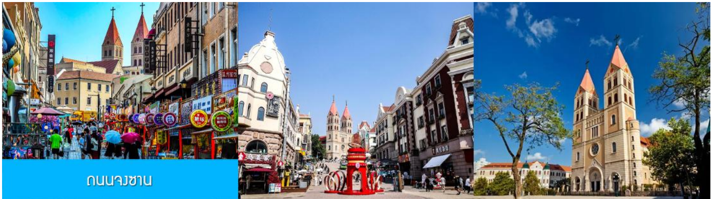
ถนนจงซาน

หลังอาหารนำท่านเดินทางชม สะพานจ้านเจียว เป็นแลนด์มาร์กประวัติศาสตร์คู่เมืองชิงเต่า สร้างเมื่อปี ค.ศ. 1891 มีลักษณะเป็นสะพานหินทอดยาวกว่า 440 เมตรสู่ทะเล ปลายสะพานมีศาลา ทรงแปดเหลี่ยมสีแดงที่โดดเด่น ซึ่งเป็นสัญลักษณ์บนฉลากเบียร์ชิงเต่า ขึ้นชื่อเรื่องวิวสวย รับลมทะเล ให้ท่านเก็บภาพบรรยากาศ จากนั้นนำท่านเดินเที่ยวชม ถนนจงซาน 中山路 ถนนที่เต็มไปด้วยกลิ่นอายยุโรป และถนนสายนี้มีบันทึก เรื่องราวมากกว่าศตวรรษของเมืองชิงเต่าไว้ ที่นี่เป็นศูนย์กลางการค้าแห่งแรกที่เต็มไปด้วยสถาปัตยกรรมสไตล์ ยุโรปเก่าแก่ที่ได้รับอิทธิพลมาจากเยอรมัน ให้ท่านได้เดินเก็บบรรยากาศ และ เก็บภาพกับ โบสถ์เซนต์ไมเคิล (ด้านนอก) โบสถ์แห่งนี้ที่คู่รักนิยมมาถ่ายภาพงานแต่งงานกันมากที่สุดในเมืองชิงเต่า ให้ท่านถ่ายรูปเก็บภาพ จากนั้นเดินทางต่อ สู่ย่าน เมืองเก่าเยอรมัน ตรอกกว้างชิงหลี่ 广兴里 ตรอกชอกชอยที่เรียงรายไปด้วยอาคาร สถาปัตยกรรมแบบ ผสมผสานจีนและอาคารสไตล์ยุโรป