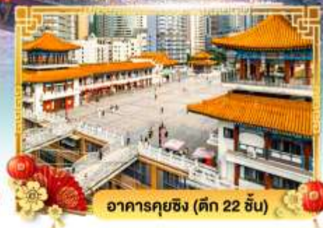
อาคารกุยชิง (ตึก 22 ชั้น)