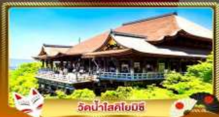
วัดน้ำสอโยมิชิ

ชมงานประดับไฟสุดอลังการ นานาโนะ โนะ ซาโตะ