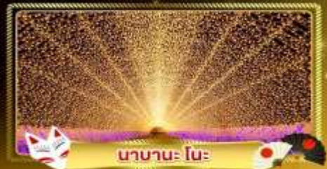
นานาโนะ โนะ