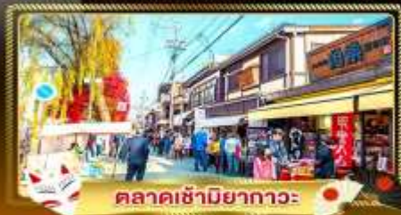
ตลาดซามิยากาวะ