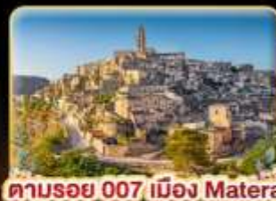
ตามรอย 007 เมือง Matera