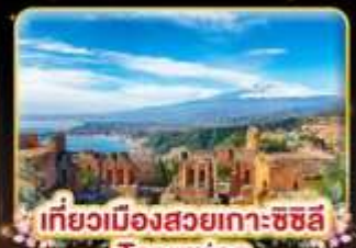
เที่ยวเมืองสวยเกาะซซิลี Taormina