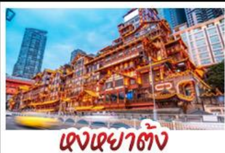
เจียงเฉียวต้ง

อุทยานหลุมบ่อฟ้า - อุทยานเขานางฟ้า หงหยาดัง - นั่งรถไฟทะเลสาบ - อุทยานสี่ดรุณี ปี้ผิงโกว - สะพานหนานเฉียว