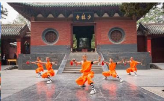
โชว์แสดงกังฟู