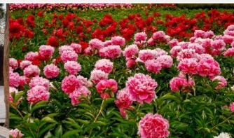
สวนดอกโบตั๋น