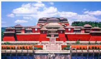
เมืองถ่ายภาพยนตร์