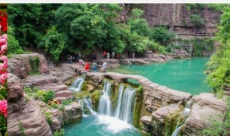
อุทยานหยุนโถซาน

*ทางบริษัทฯ ขอสงวนสิทธิ์ในการสลับโปรแกรมทัวร์ตามความเหมาะสมขึ้นอยู่กับสถานการณ์หน้างาน โดยคำนึงถึงผลประโยชน์ของลูกค้าเป็นสำคัญ