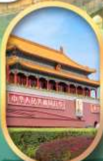
จัสมุติสเทียนอันเหมิน