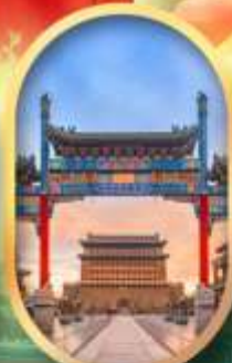
ถนนคนเดินเทียนเหมิน