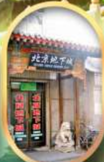
เมืองโบราณใต้ดิน