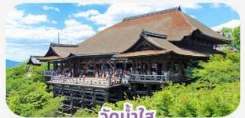
วัดน้ำใส