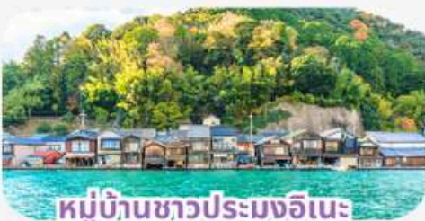
หมู่บ้านชาวประมงอินะ