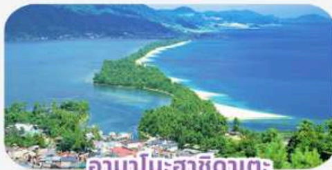
อามาโนะฮาซิดาเตะ