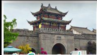
เมืองโบราณกวนเซี่ยน

ภูเขาสี่ดรุณี - อุทยานป่ฝิงโกว - สะพานหมานเฉียว - ร้านหนังสือจงซูเก๋ - เมืองโบราณกวนเสียน จตุรัสหยางเทียนหวู่ - หมีแพนด้าเซสพี - ถนนโบราณชอยกวางชอยแคบ - ถนนคนเดินไท่กู๋หลี่ ถนนคนเดินซุนซี - ถนนโบราณจินหลี่ - แพนด้ายักษ์ปิ่นตึก - น้ำพุไม้ไผ่ตึกSKP - วัดต้าอ้อ