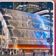
เรือหลุยส์