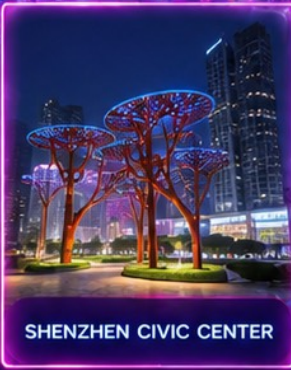
SHENZHEN CIVIC CENTER