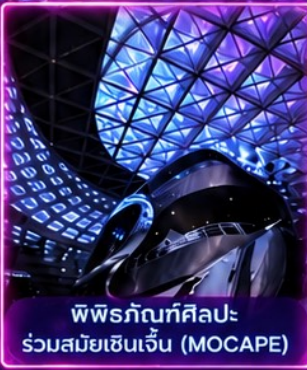
พิพิธภัณฑ์ศิลปะ ร่วมสมัยเซินเจิ้น (MOCAPE)