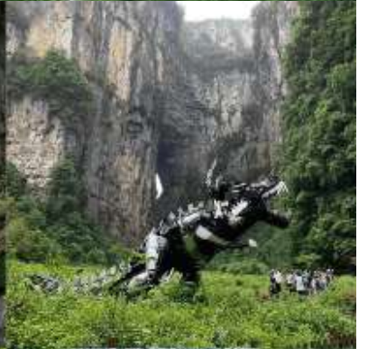
THREE NATURAL BRIDGE