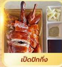
เปิดปาทัง