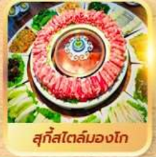
สุกีสโตลมองโก