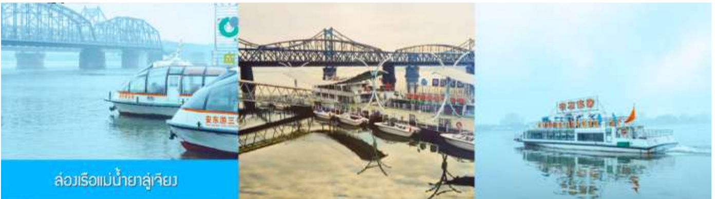
ล่องเรือแม่น้ำยาลู่เจียง

หลังอาหารให้ท่านพักผ่อนตามอัธยาศัยในโรงแรม