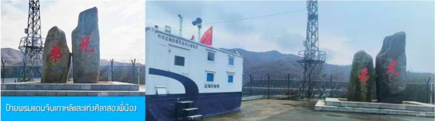
ป้ายพรมแดนจีนเกาหลี่และแท่งศิลาสองพี่น้อง