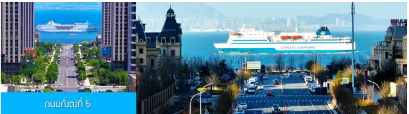
ถนนกังตง 5