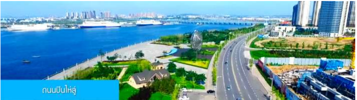
ถนนปินไห่หลู่

ล้อมด้วยตึกระฟ้าที่ทันสมัย ภายในมีบ่อน้ำพุคนตรี ลานหญ้าขนาดใหญ่ และลานกว้างสำหรับจัดกิจกรรม กลางแจ้ง อาทิ เทศกาลเบียร์นานาชาติ การแข่งขันวิ่งมาราธอน งานแฟชั่นนานาชาติเมืองต้าเหลียน ฯลฯ