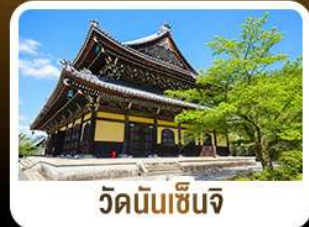
วัดนินเซ็นจิ