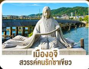
เมืองอจิ สวรรค์คนรักชาเขียว