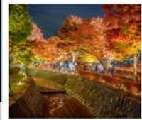
อุโมงค์เมบิซ