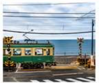
รถไฟเอโนะเด็ตสึ