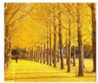
สวนเอ็กซ์โป