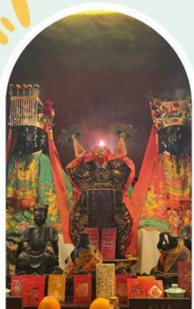
วัดหมิ่นโหมว