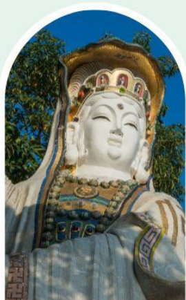
เจ้าแม่กวนอิม ธิพลสัย