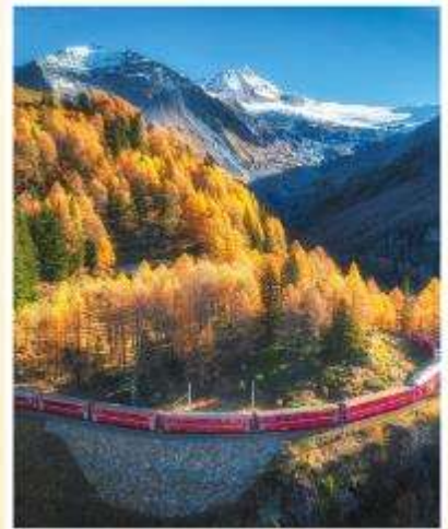
BERNINA EXPRESS Unesco