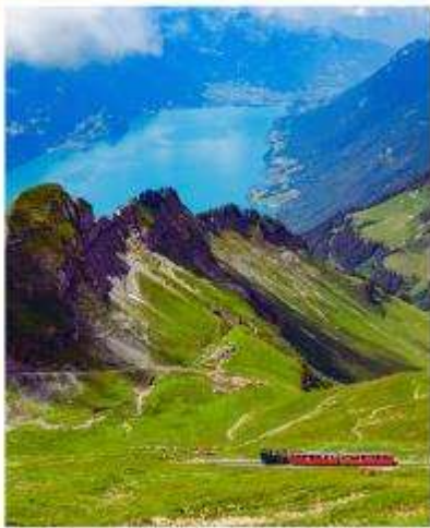
BRIENZER ROTHORN Sorenberg Schonenboden