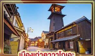
เมืองเก่าคาวาโกเอะ