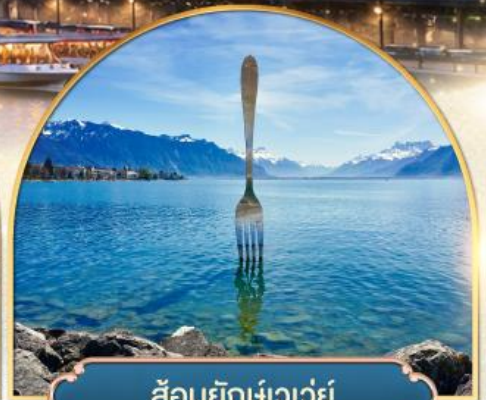
ส้อมยักเขาวัว