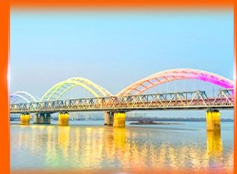
สะพานรถไฟพินโจว