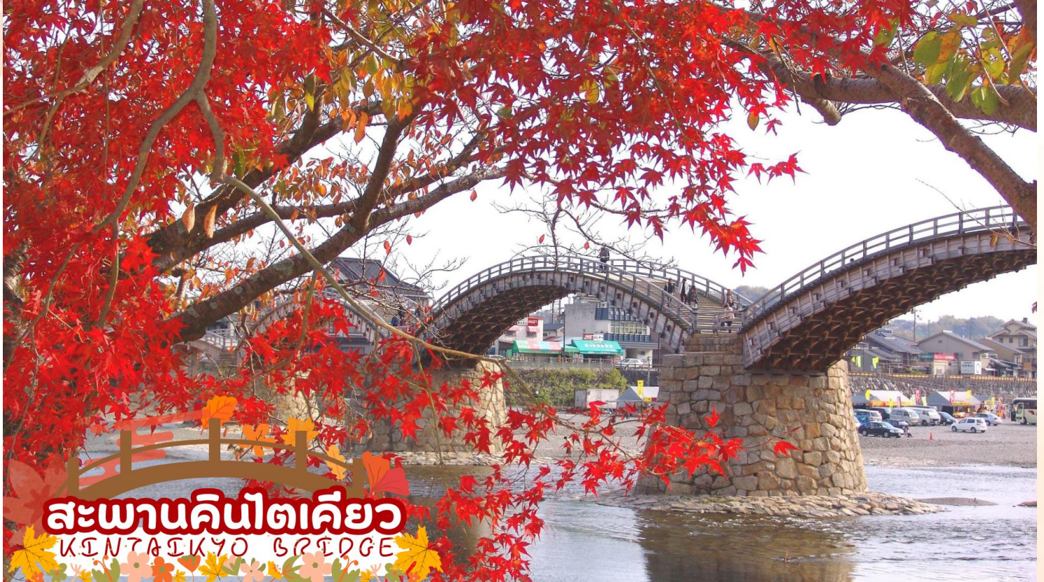
สะพานคินไตเคียว KINTAI KYO BRIDGE

ชมความงามของ สะพานคินไตเคียว (Kintai Kyo Bridge) สะพานไม้ 5 โค้ง 1 ใน 3 สะพานที่สวยงามที่สุดในญี่ปุ่น สร้างครั้งแรกเมื่อปี พ.ศ. 2216 แต่พังทลายลงในปีต่อมา จึงได้มีการสร้างขึ้นใหม่และอยู่มายาวนานกว่า 270 ปีจนกระทั่งถึง พ.ศ. 2493 สะพานแห่งนี้ได้พังทลายเพราะถูกพายุไต้ฝุ่นคิโยะพัดทำลาย ชาวเมืองอิวาคุนิเลยพร้อมใจกันสร้างสะพานขึ้นมาใหม่อีกครั้งตามรูปแบบเดิม (ใบไม้เปลี่ยนสีขึ้นอยู่กับสภาพอากาศ)