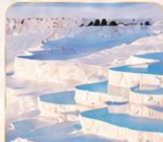
PAMUKKALE ปานุกคาล่า