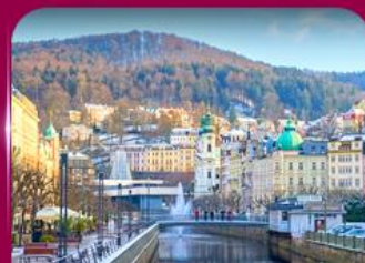
เมืองสปาแสนสวย คาร์โลว วารี