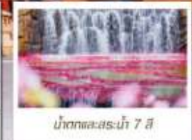
น้ำตกทะเลสาบไห่ 7 สี

📦 โหลด 23 KG. x1 ทั้งไป - กลับ ✓ ฟรีนียบตัว ✓ ไม่เข้าร้านรัฐบาล ✓ ทีวีรูปเล็ก ✓ รวมค่าเข้าชมตามที่ตามโปรแกรม