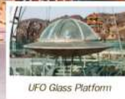
UFO Glass Platform