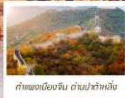
กำแพงเมืองจีน ด่านป่าต้าหลิ่ง