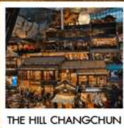
THE HILL CHANGCHUN