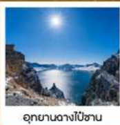
อุทยานดางโป่ซาน