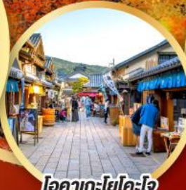
โอคากะโยโคโจ