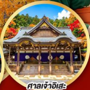
ศาลเจ้าอิสะ