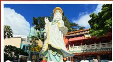
เจ้าแม่กวนอิมรัฟัสเบย์