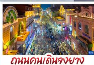
ถนนคนเดินจงยาง