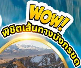
ถนนโบราณ ผานหลง