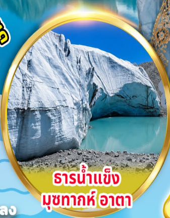
ธารน้ำแข็ง มุขทากห์อาตา