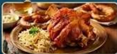
อิมอร่อยเมนูขามูเยอรมัน