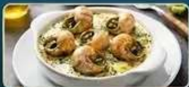
ลิ้มลองเมนูหอยเอสคาโก้