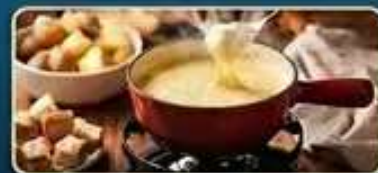
ลิ้มลองเมนูฟองดูร์ สไตส์สวิส