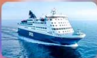
พักบนเรือสำราญ แบบ Window Room 1 คืน