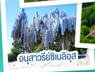
อนุสาวรีย์ซีเบลิอุส