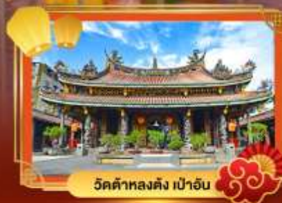
วัดต้าหลงตั้ง เป่าอัน