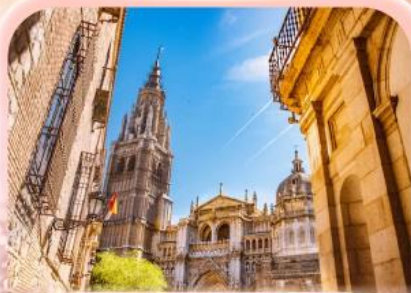
มหาวิหารแห่งโทเลโด